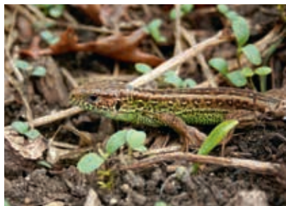
Leben auf dem Waldenstein. Von oben: Schachbrettfalter, Rotes Waldvöglein, Hummelschwärmer, Zauneidechse.