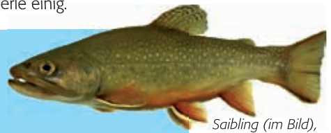
Saibling (im Bild), Lachs, Forelle, Dornade, Wolfsbarsch: Die meisten Zuchtfische sind Raubfische. Sie mögen Maden.

Hier sucht ein weiteres vom Coop Fonds für Nachhaltigkeit unterstütztes FiBL-Projekt nach besseren Lösungen. Mit Reststoffen aus der Lebensmittelindustrie sollen Fliegenlarven gezüchtet und als Fischfutter eingesetzt werden. Die Schwarze Soldatenfliege ( Hermetia illucens ) ist hierfür besonders geeignet.