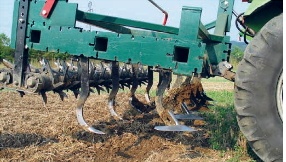
Grubber für die reduzierte Bodenbearbeitung. Die schmalen Zinken lockern den Boden, die breiten Scharen unterschneiden ganzflächig Unkräuter und Gräser.