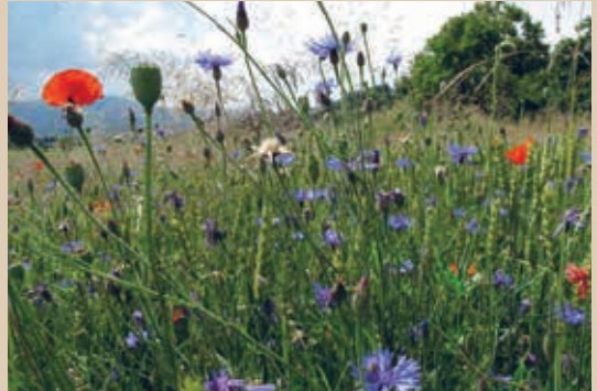
Biofeld mit artenreicher Ackerflora, Hof Ortbühl.